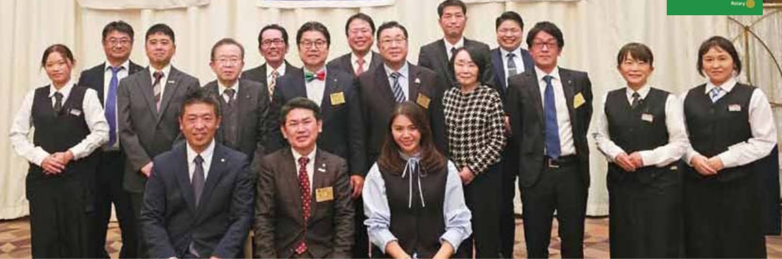
クリスマス例会 (ダイヤモンドホール)