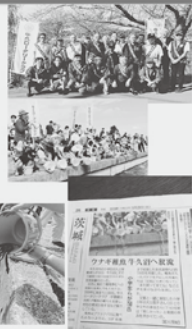
写真は牛久RC 牛久沼へのウナギの稚魚放流プロジェクト 実施風景