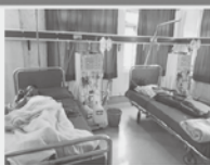
人道的プロジェクト