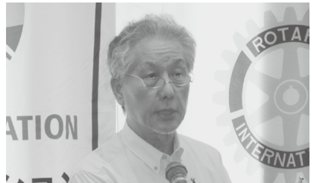
関係委員会を支援し、お互いに情報交換をしながら会員増強、特に退会防止を目指しました。