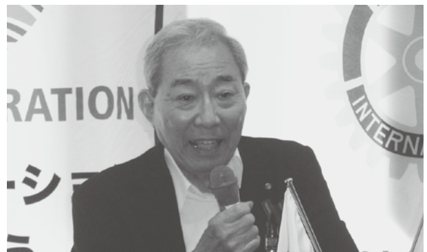
推薦された候補者がクラブ会員としての適格性について公正に調査選考し、速やかに理事会