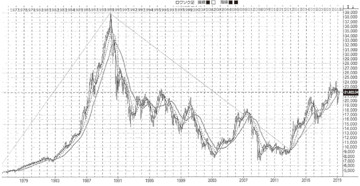
日経平均株価 2 2 5 種 (101/T) 月足 1976/04~2019/03 [516本]ロウソク足