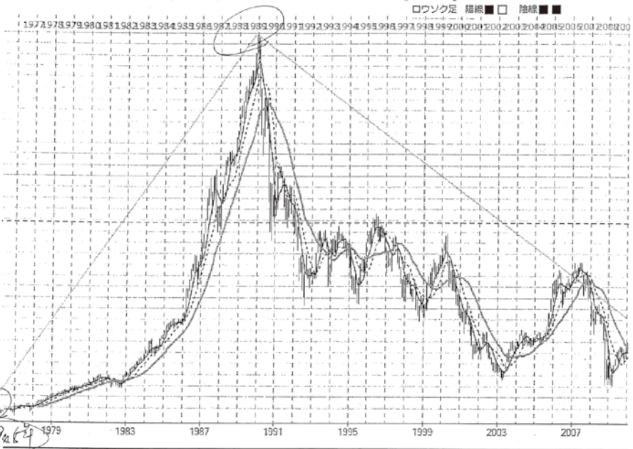
日経平均株価 2 2 5 種 (101/T) 月足 1976/04~2019/03 [516本]ロウソク足