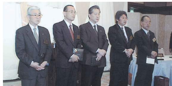
◀ 会員誕生スナップ